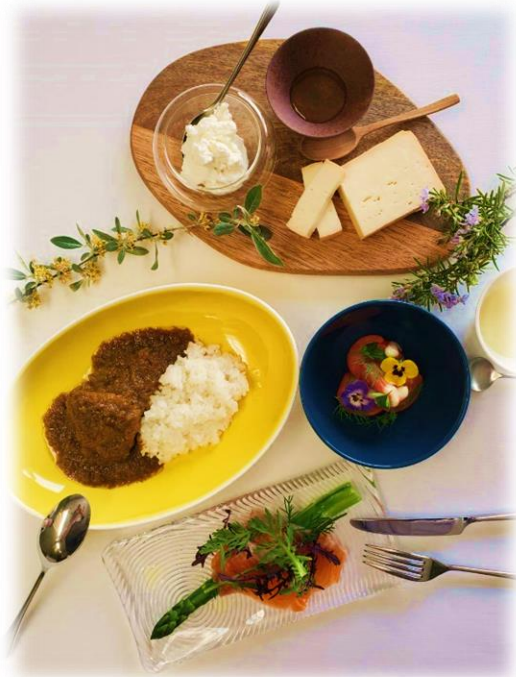
盛りつけイメージ(約1人前) ※白米はセットには含まれません。

【お支払い方法】代引きで承ります。受注後、税金、送料、代引き手数料込のお支払い金額をご連絡差し上げます。贈答等でご利用の際は銀行振込も承ります。